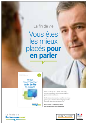
Une affichette informative