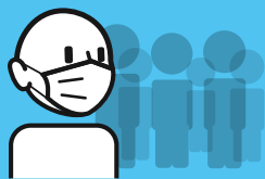
Portez un masque lorsqu'il y a du monde ou si vous êtes malade