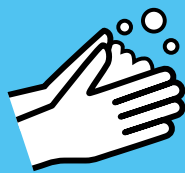
Lavez-vous les main