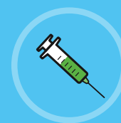
Vaccin contre la grippe, covid et certaines gastro-entérites

Pour les enfants ou personnes fragiles, si vous êtes malade, il faut voir un médecin. S'il n'est pas disponible, appelez le 15